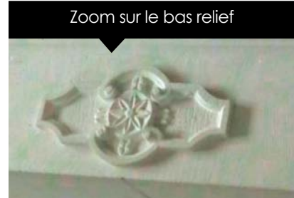
Zoom sur le bas relief