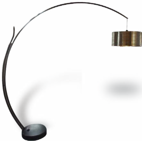
Atelier de Jérôme

Lampadaire industriel en acier brut réalisé par l'atelier de Jérôme.