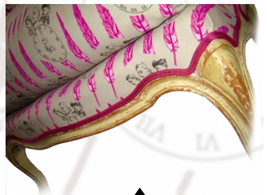
Application sur une bergère...

Choix du tissu support (velours ras...) à votre convenance.